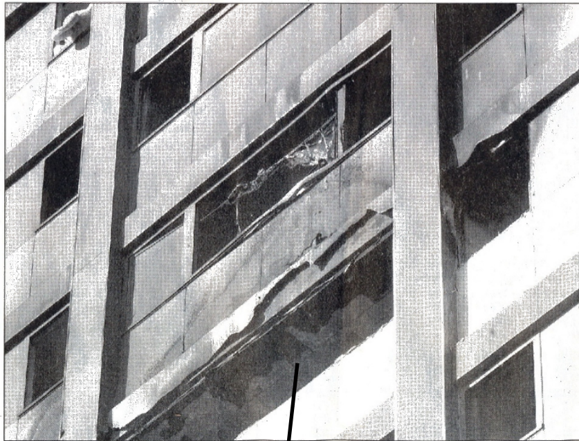
Le projet est destiné à revitaliser le quartier qui vit avec le douloureux souvenir de l'incendie de la résidence des Mésanges, dans la nuit du 19 au 20 février 2003.

Le projet est destiné à revitaliser le quartier qui vit avec le douloureux souvenir de l'incendie de la résidence des Mésanges, dans la nuit du 19 au 20 février